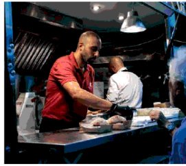
Aperitivo in Jazz