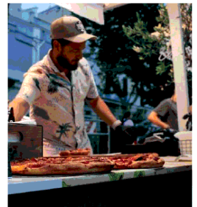
Aperitivo in Jazz