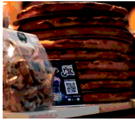
Aperitivo in Jazz