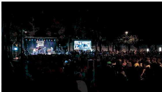
Piazza Vittorio Emanuele