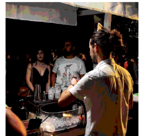
Oil Bar After

rizzare e a promuovere presso il numeroso pubblico proveniente dalle città limitrofe o in vacanza in città.