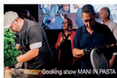
Cooking show MANI IN PASTA

" Cooking Show Le mani in pasta " dedicato alla nobile arte bianca della panificazione con due prodotti di eccellenza che rappresentano la tradizione gastronomica pugliese e italiana nel