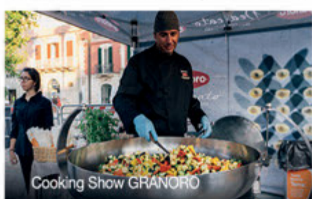
Cooking Show GRANORO

Il programma Jazz 2024 propone un cartellone musicale di qualità con un