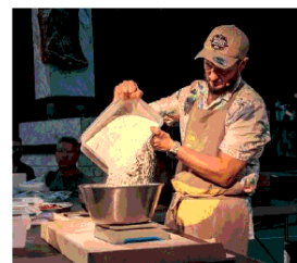
Cooking Show Mani in Pasta

È un'occasione unica per conoscere la città dell'olio extravergine di oliva da cultivar "Co-ratina" con le sue chiese (Santa Maria Maggiore, San Vito, Maria SS. Incoronata, Santa Maria Greca, San Domenico, San Benedetto, Madonna del Carmelo, San Francesco) e i suoi palazzi storici (Gioia, De Mattis, La Monica, Catalano, Gentile Griffi, Spallucci) che racchiudono piccoli tesori, lontani dai circuiti del turismo di massa. Tanti i monumenti simbolo del potere religioso e laico disposti lungo le vie cardine della città, che il Festival GustoJazz contribuisce a valo-