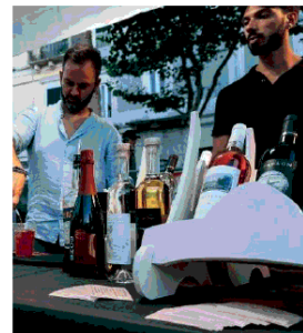
Aperitivi in Jazz