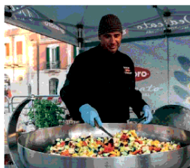
Cooking Show Granoro